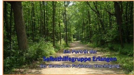
Vorstellung der Erlanger Regionalgruppe: „Parkinson – das Leben geht weiter“ (2017)